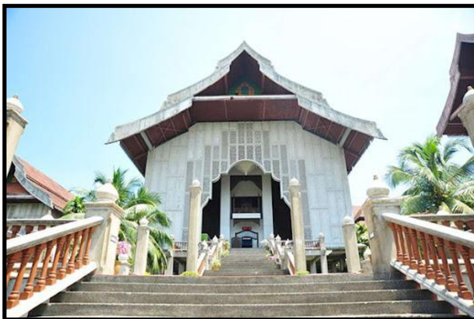
Rajah 1 Muzium Negeri Terengganu